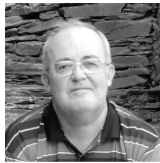
Por: José Lapa